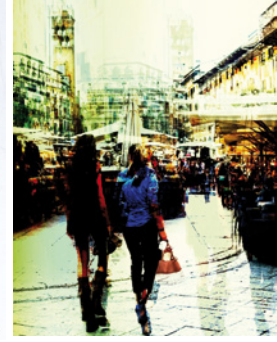
◀◀ Ela Schwartz