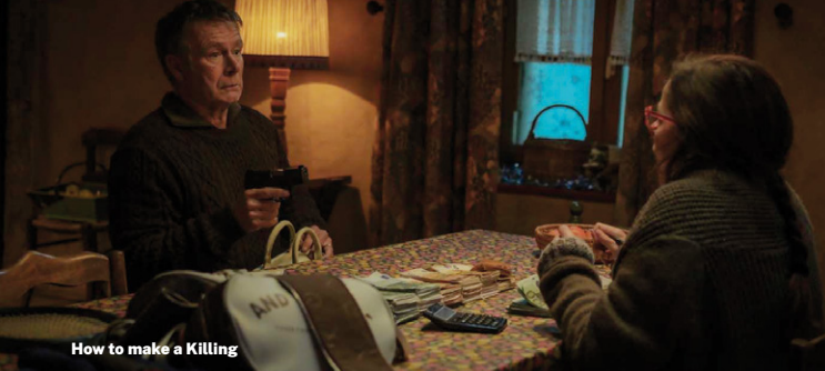
How to make a Killing