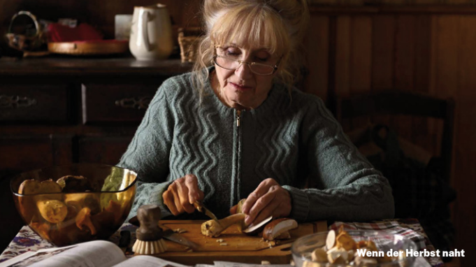
Wenn der Herbst naht