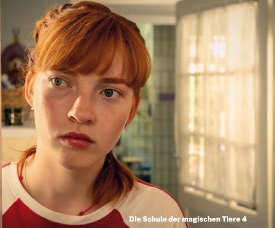
Die Schule der magischen Tiere 4