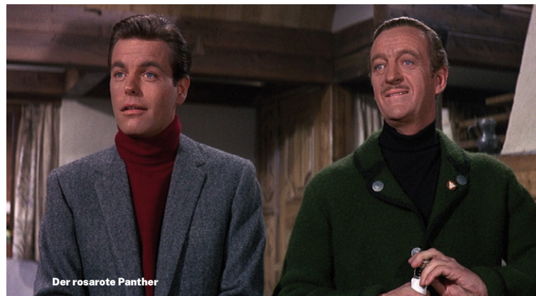
Der rosarote Panther

Drama, F/B 2024 · 106 Min · FSK 6 · 6,00 EUR