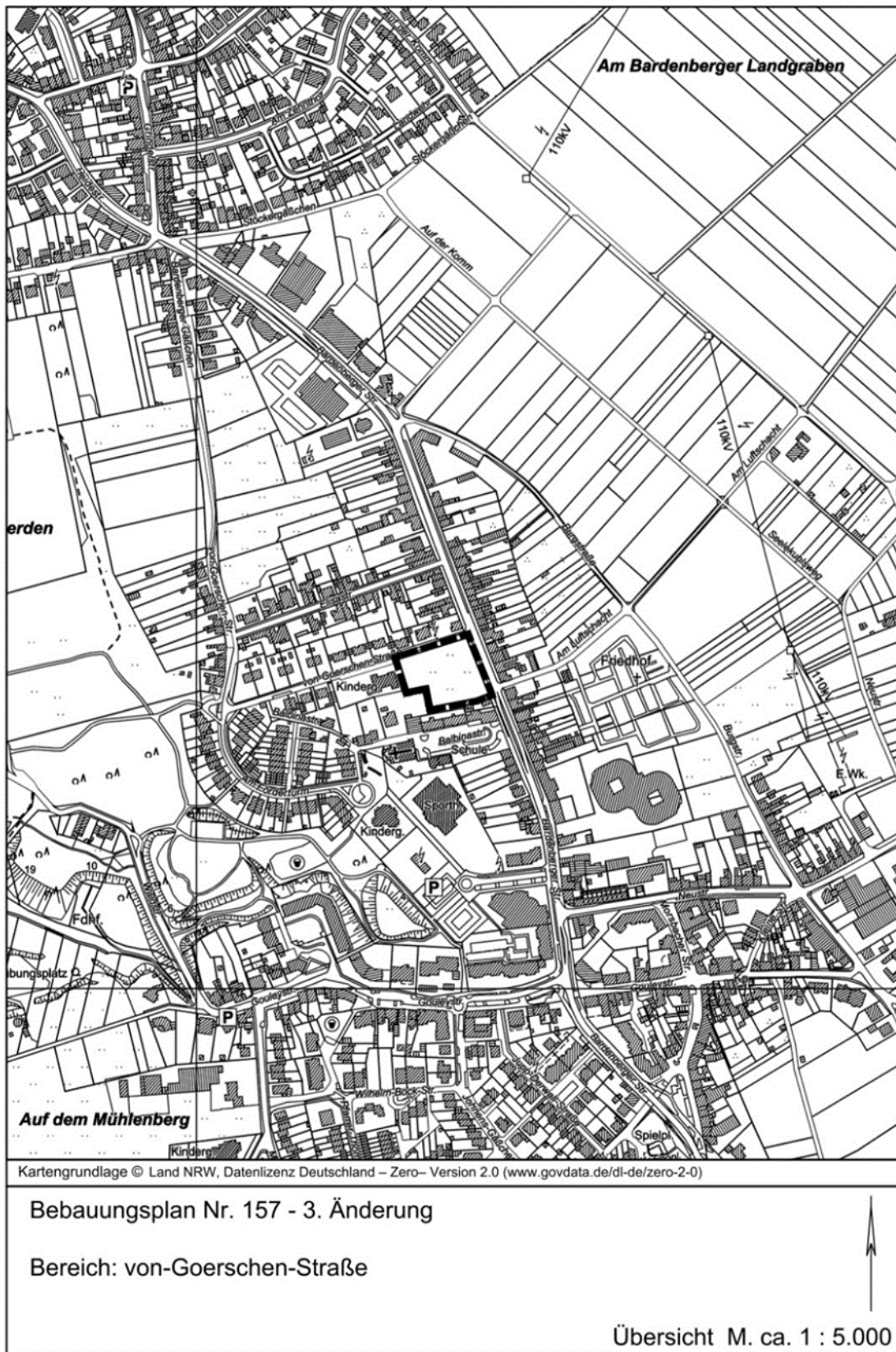
Lageplan und Geltungsbereich der 3. Änderung BP 157 (ohne Maßstab)